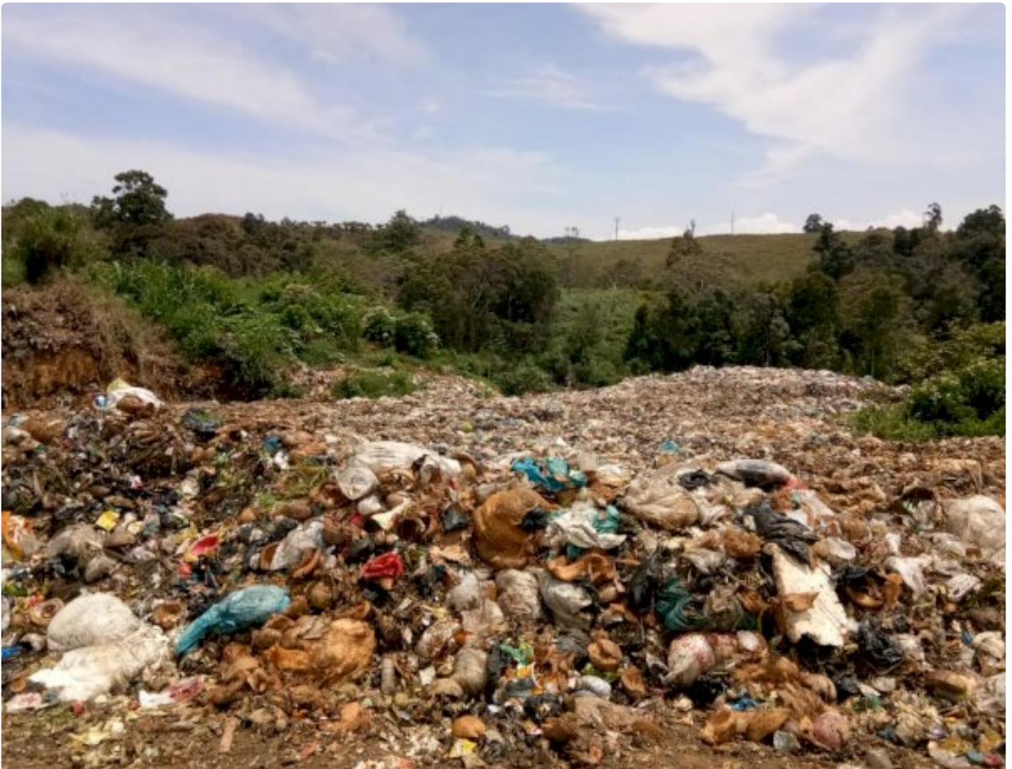
Desa Renah Kayu Embun (RKE) kecamatan Kumun Debai tempat pembuangan akhir sampah

SUNGAIPENUH, JAMBI - Persoalan sampah kian komplis dan menjadi masalah serius, Hingga kini belum ada obat yang mujarab mengatasi persoalan ini.